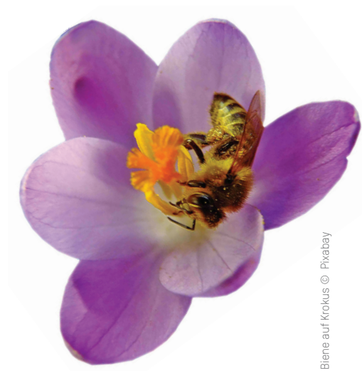
Biene auf Krokus